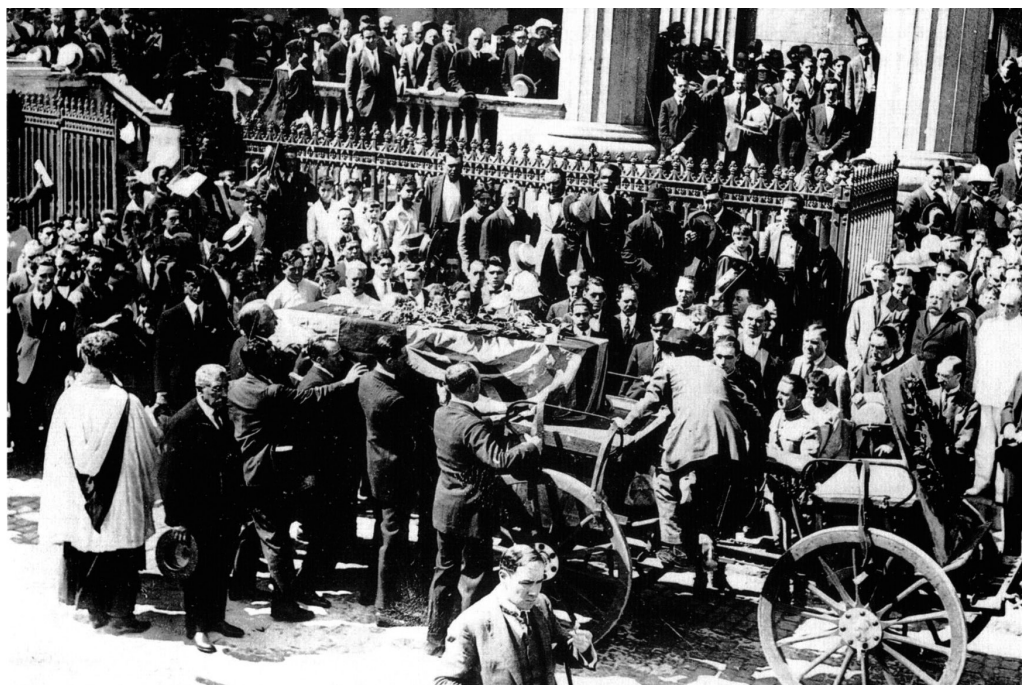
Fig. 4. Imponente perspectiva del grandioso cortejo que acompañó los restos hasta la dársena. “En “Hoy fue tributada una solemne despedida a los restos de Sir Ernesto Shackleton. “En El Plata” - 15 de Febrero de 1922. Pág. Pág. 10- Col. 2-3-4