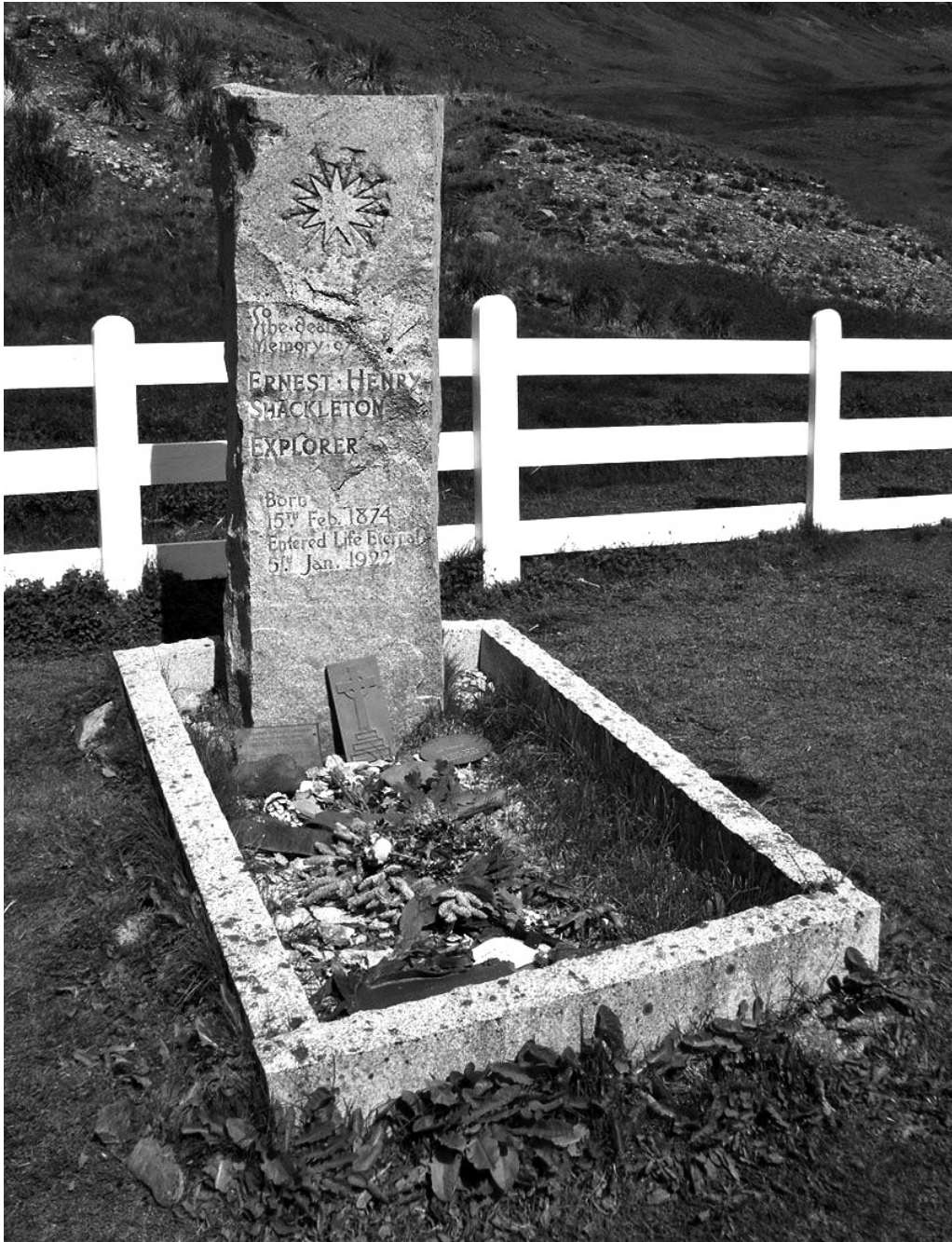
Fig. 5. Tumba de Schackleton en South Georgia. http://elrincondenanuk.blogspot.com/2014/03/ernest-shackleton-la-lucha-por-la.html