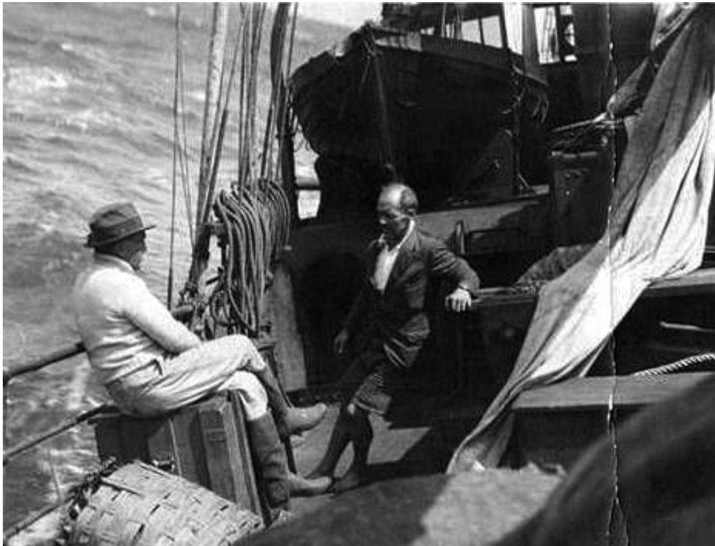
■ Fig. 1. Shackleton y Wild