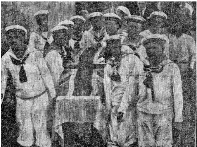
■ Fig. 2. El ataúd al sacarlo del depósito del "Professor Gruvel" En: "Ayer llegaron a Montevideo los restos del explorador Shackleton..." - "El Plata" - 30 de Enero de 1922. Pág 8- Cols. 1-2 -